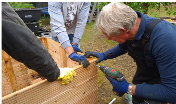
3.) Die Dielen werden mit Sternschrauben zusammengeschraubt.