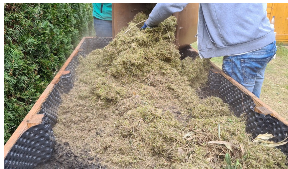
24.) Rasenabfälle kommen über die Laub- und Grünabfälle.