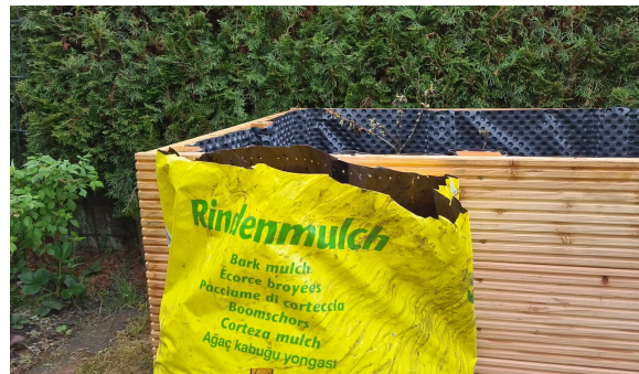
20.) Rindenmulch füllt die Zwischenräume der ersten und zweiten Schicht.