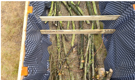
19.) Zunächst werden die groben Äste und Zweige in das Hochbeet gelegt.