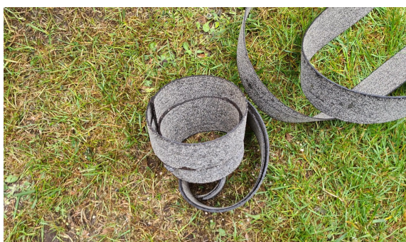
7.) Mit Mauersperrbahn-Streifen schützen wir die Unterseite des Kastens.