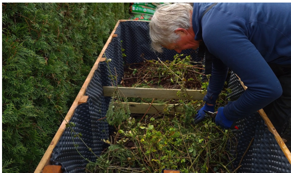
21.) Kleinere Äste kommen auf die groben Äste und Zweige.