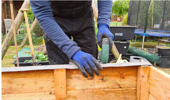
9.) Mit einem Akkutacker werden alle Seitenstreifen befestigt.