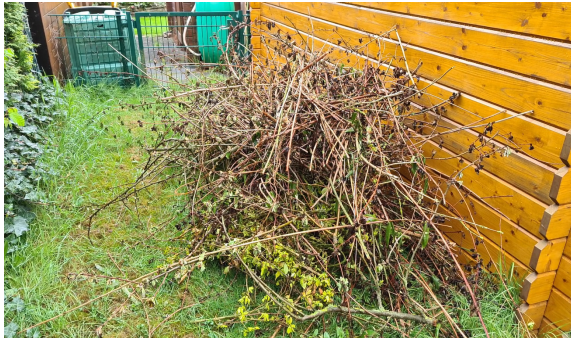
17.) Für das Hochbeet benötigen wir eine Menge Baum - und Strauchschnitt.