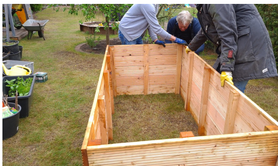
5.) Das Hochbeet sollte mindestens zu zweit aufgebaut werden.