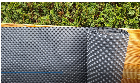
15.) Die Noppenfolie schützt das Holz vor Feuchtigkeit.