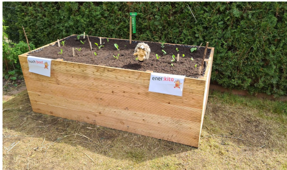
1.) Unser wunderschönes ener:kita-Hochbeet.