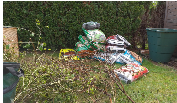
18.) Zusätzlich brauchen wir Rindenmulch, Grob- und Feinkompost sowie Hochbeeterde.