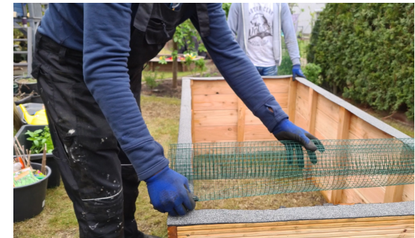
12.) Das Gitter zuschneiden und auf den Kasten legen.