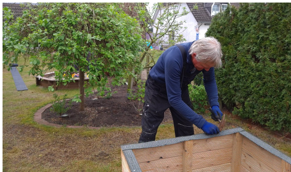
13.) Mit Nägeln wird das Gitter auf dem Streifen befestigt.