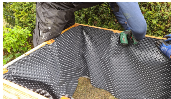
16.) Mit dem Elektrotacker wird die Folie an die Innenseite des Kastens befestigt.