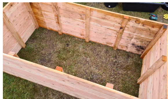
6.) Der Hochbeetkasten ist fertig.