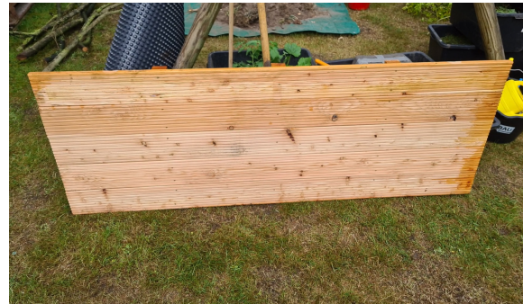
2.) Vier Fertige Lärchenholz-Dielen, Maße (2 x 1 Meter) .