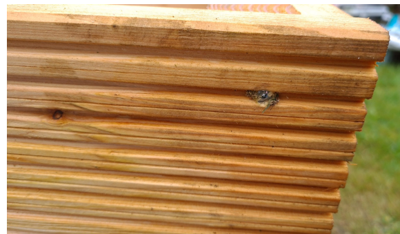
4.) Darauf achten, dass die Teile gut verschraubt werden.