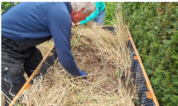
23.) Laub und Grünabfälle werden über die Zweigschicht gelegt.