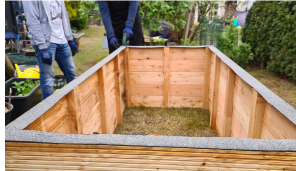
10.) Darauf achten, dass alle Ränder mit Mauersperrbahn-Streifen belegt werden.