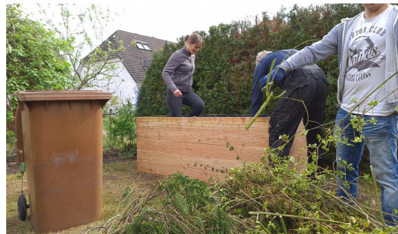
22.) Wichtig! Die Schichten immer wieder platttreten um Hohlräume zu vermeiden.