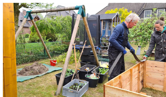
8.) Die Streifen werden an die Seitenränder des Hochbeetes gelegt.